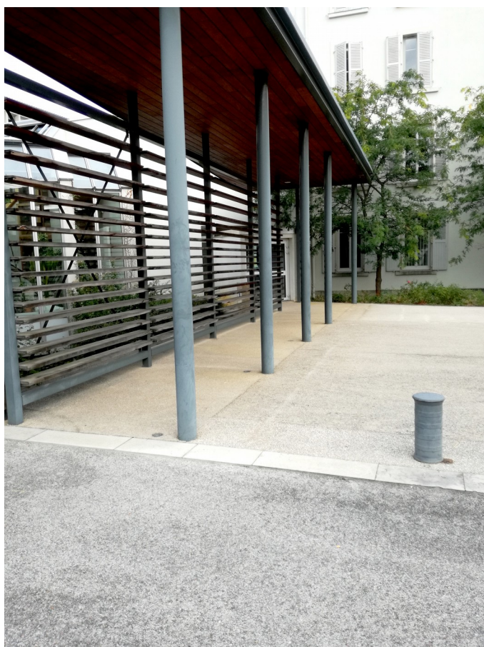
Rampe sur parvis accueil