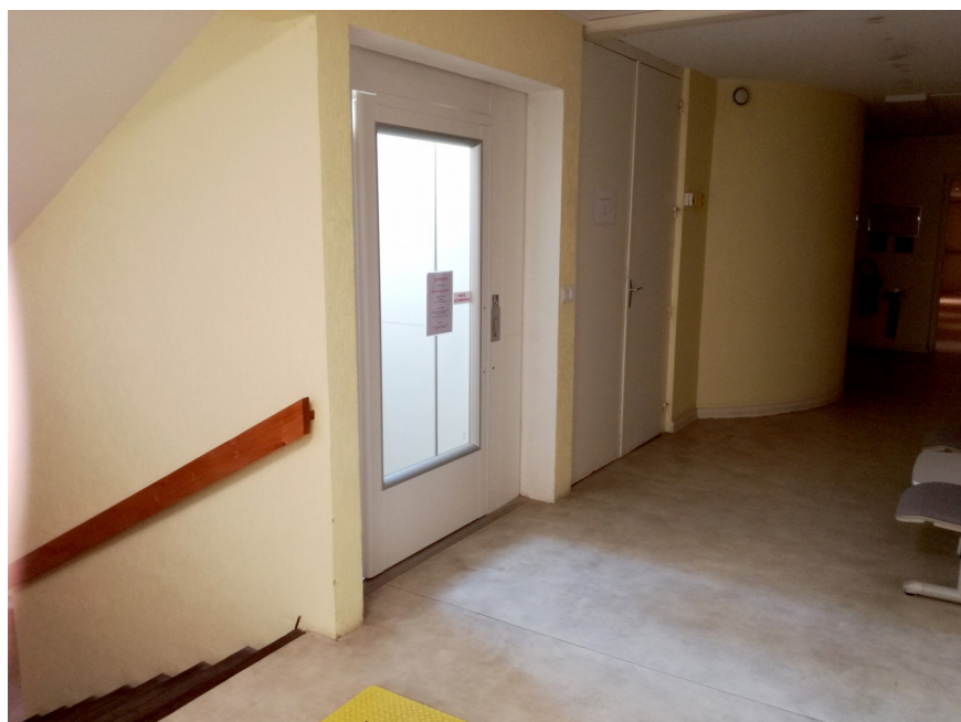
Accès bâtiment N Niveau 0 Pôle médico-social