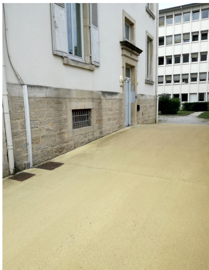
Rampe arrière bâtiment A