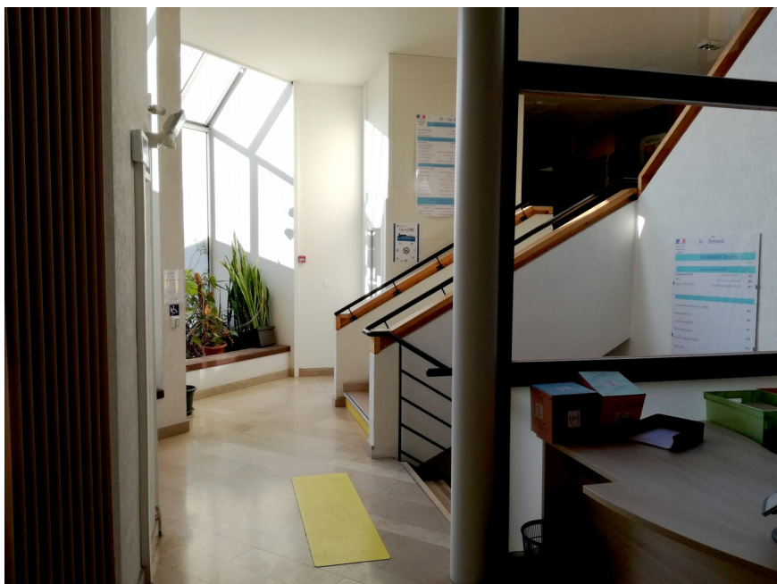
Accès plateforme Élévatrice Bâtiment N depuis l'accueil