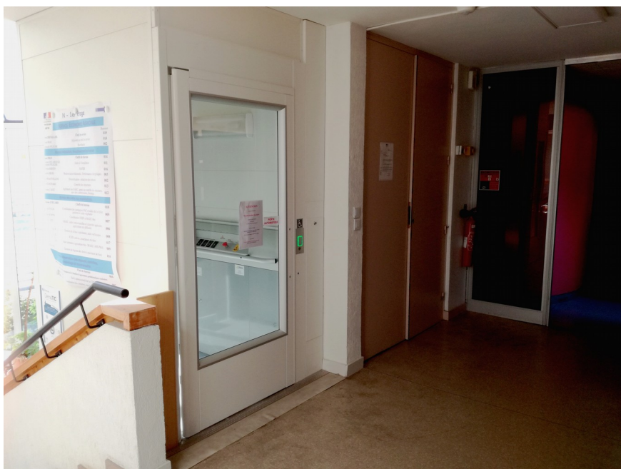
Accès bâtiment N Niveau 1 Service d'Economie Agricole